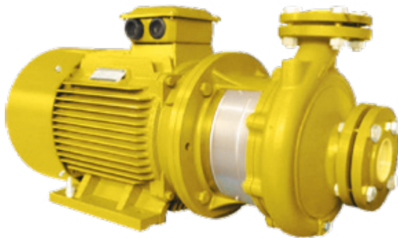
توان 11 کیلووات