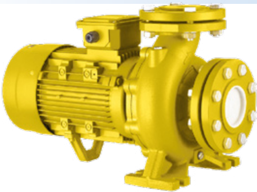
توان های 3 الی 7.5 کیلووات