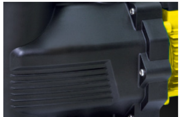
بدنه کاملا یکپارچه و ضد آب