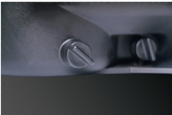
مجهز به شیر تخلیه جهت جلوگیری از یخ زدگی