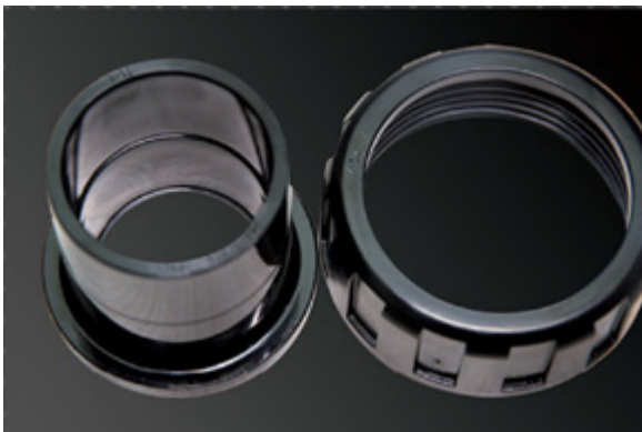
اتصالات مهره ماسوره ای از جنس PVC در سایز ۵۰