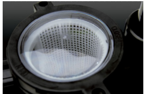
مجهز به استرینر سرخود به همراه سبد پلاستیکی